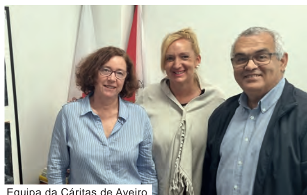
Equipa da Cáritas de Aveiro